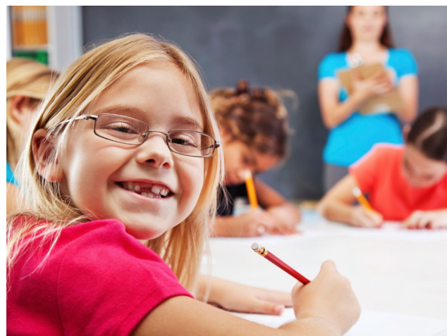
Kinderen hebben verschillende onderwijsbehoeftes en verdienen afstemming

De deskundigen bevoegd gezag werken op bestuursniveau. Zij voeren namens het schoolbestuur de dialoog met de school en de ouders. Indien zij de aanvraag onderschrijven, kan deze naar de TAC verstuurd worden. De hoofd doelstellingen van de TAC zijn het verstrekken van toelaatbaarheidsverklaringen voor het SO of SBO en het tekenen van arrangementen uit te voeren op de school zelf middels extra ondersteuning.